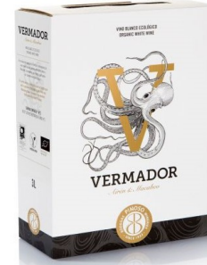
Airen - Macabeo